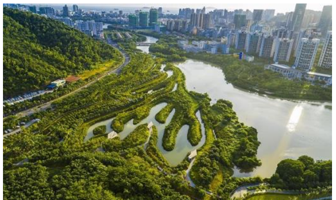
Foto: Kongjian Yu, Red Ribbon v Qinhuangdao, China a S...Park – zdroj IFLA