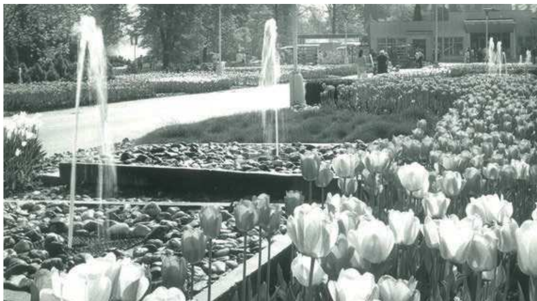
Fontánová alej, autoři Hynek, Hradil, Finger – Flora 1967

Nastupující komunistická garnitura tvůrčí tým rozmetala, někteří kolegové emigrovali. Flora Olomouc pak už nikdy nedosáhla takového mezinárodního zájmu a vysoké návštěvnosti. Slabou útěchou je to, že desítky kolegů i výtvarníků si z té doby nesou cenné zkušenosti a poznatky a vesměs se výborně uplatnili na svých následných pracovištích. ■