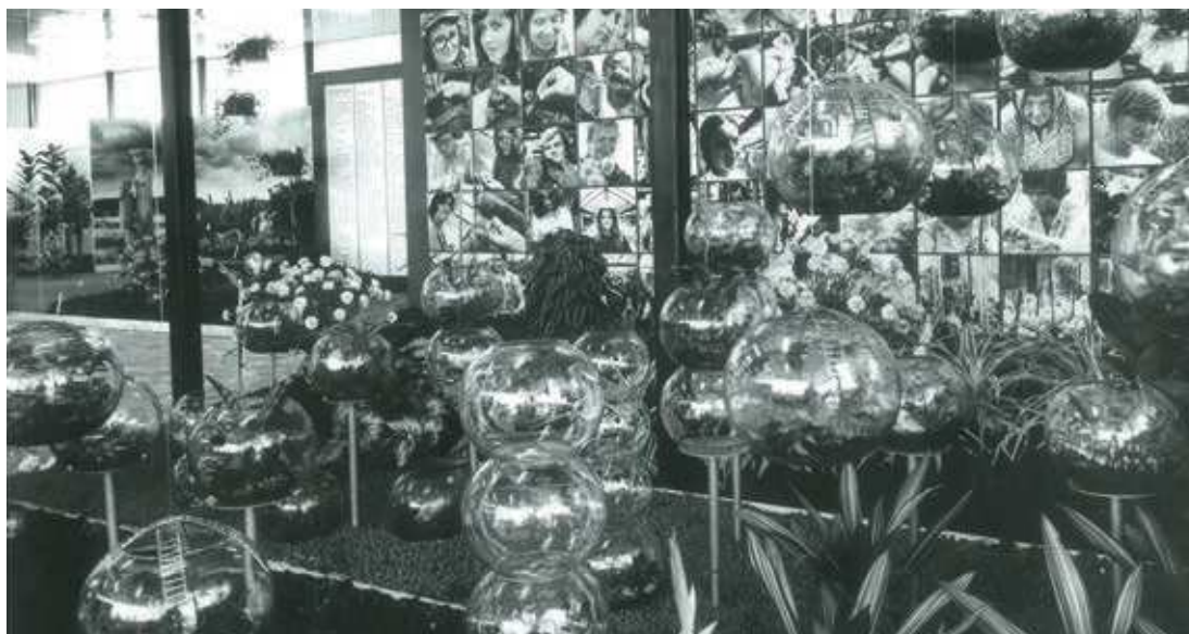
Pavilon Sempry Praha s fotogalerií jejich zahradnic – Flora 1967