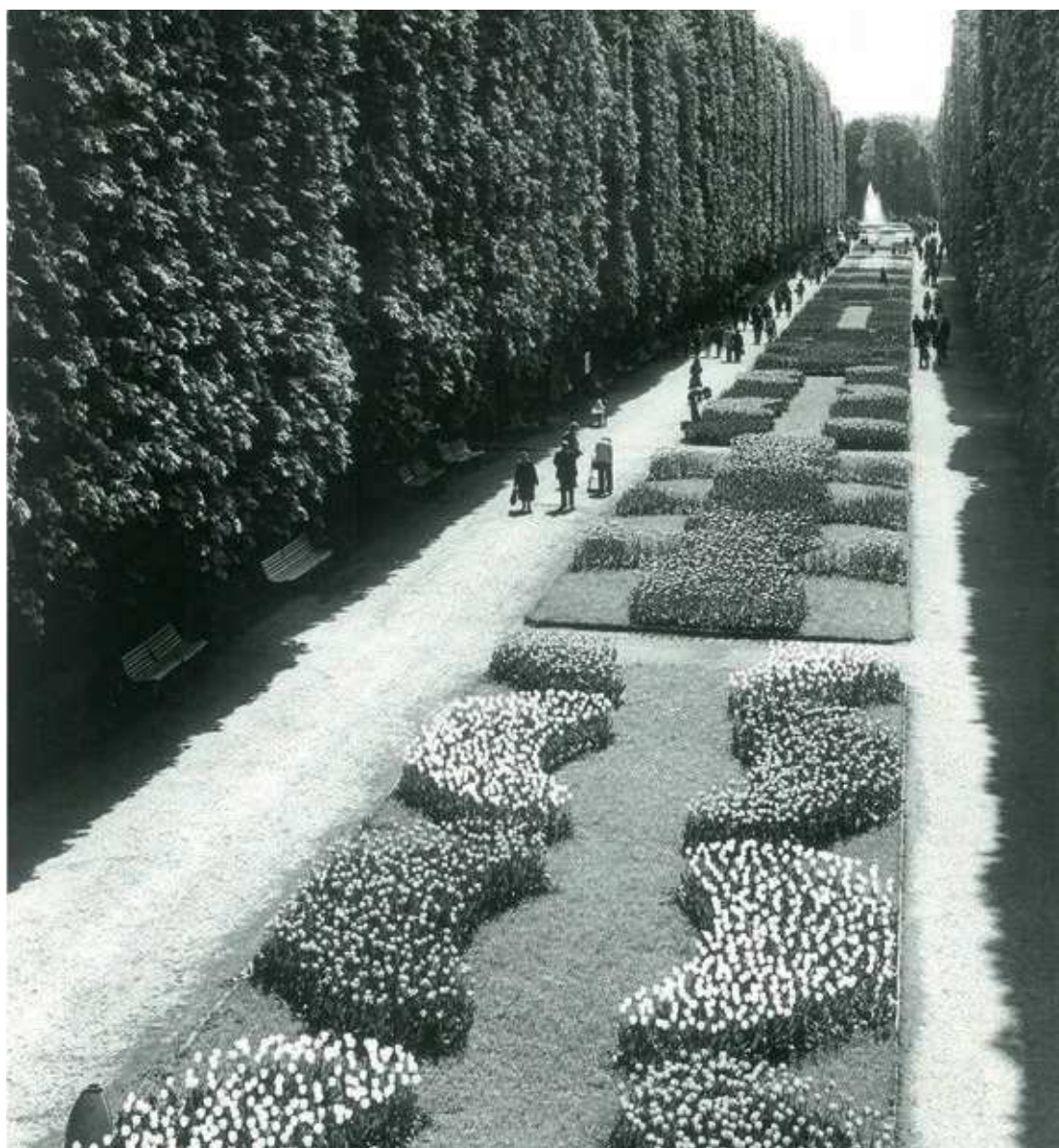
Hlavní alej výstaviště