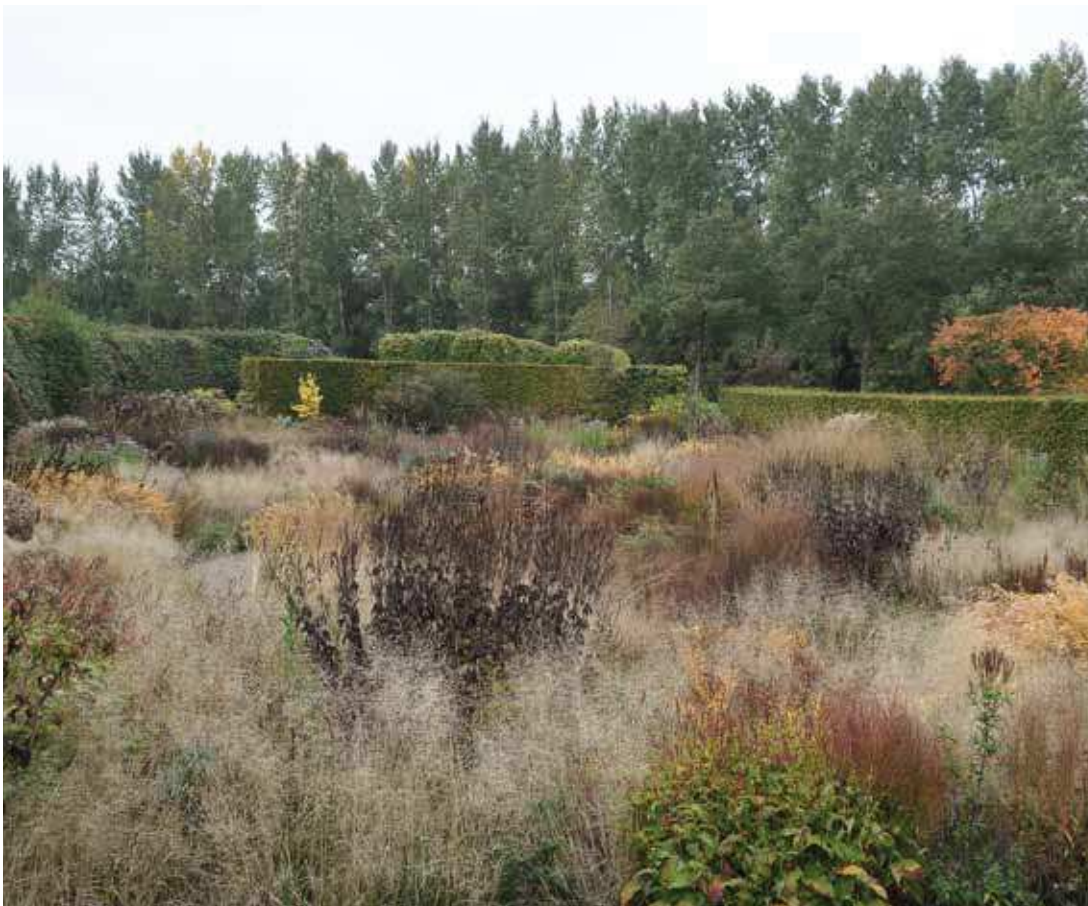
Pohled od domu směrem do hlavní zahrady plné trvalek a obehnané živými ploty

Do Hummela jsme dorazili brzy ráno, na polích a pastvinách se válela mlha a na obzoru se tyčily tmavé siluety stromů. Zahradu obtěžkávala rosa. Byla to ta správná atmosféra pro návštěvu podzimní zahrady Pieta Oudolfa. Ve druhé polovině října se už většina zahrad ukládá k zimnímu spánku, v Hummelu však bylo stále co obdivovat. V mlhavém počasí vynikly tmavé struktury usychajících trvalek, rozmanitá květenství pohupujících se trav a poslední barvy květů hvězdnic. Pod Oudolfovým známým heslem „Hnědá je také barva“ bylo možné rozpoznávat tisíc a jeden odstín od zlatavých tónů květenství Calamagrostis 'Karl Foerster' či podzimních listů Amsonia tabernaemontana po temně černohnědém květenství Veronicastrum či Agastache nepetoides , která kontrastovala se zelenožlutými stonky. V zahradě jsme objevili nejednu rostlinu, kterou nedokázal určit ani široký kolektiv našich odborníků. Kromě skvělé atmosféry počasí jsme však měli štěstí i na samotného tvůrce zahrady, který nás uvítal, společensky s námi prohodil pár slov a pomohl určit některé trvalky. Když jsem se ho ptala, který ze svých projektů má nejraději, šibalsky se usmál a povídá: „Myslíte kromě mé vlastní zahrady?“