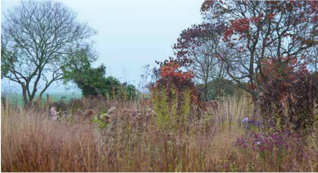
Pohled přes trvalkovou louku daleko za hranice zahrady na pastviny v mlze