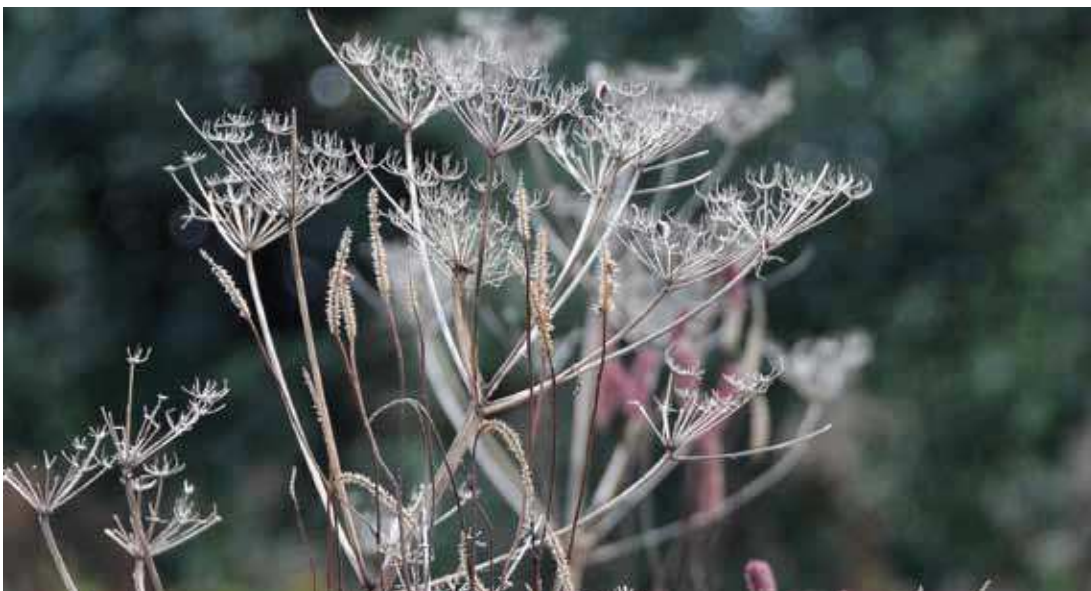
Detail odkvetlého květenství miřkovitých a Sanguisorba