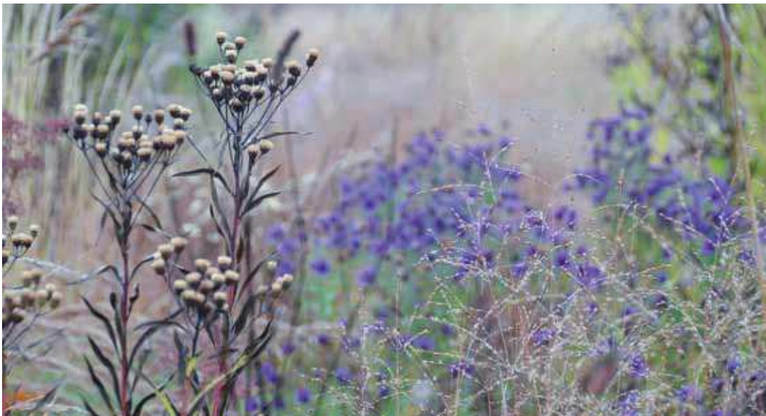
Detail struktur trvalek a okrasných trav v zamžlém ránu