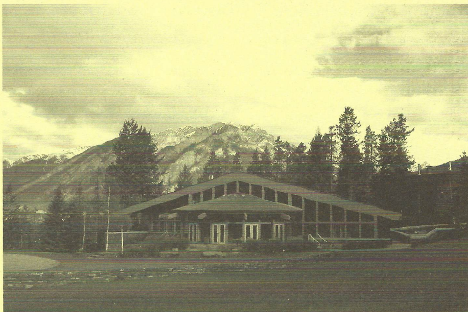
Banff, TransCanada Pipelines Pavilion, místo dvoudenního jednání Světové rady IFLA