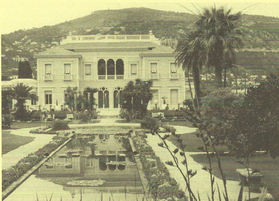
Villa Ephrussi de Rothschild

Diskuse se rozvinula k citlivému tématu nedostatečné komunikace dřívějších absolventů zahradnické fakulty s pedagogy, resp. problematice zapojení čerstvých absolventů, kteří do jisté míry postrádají během studia kontakt s dalšími profesemi, do praxe. Z diskuse vyplynul apel na