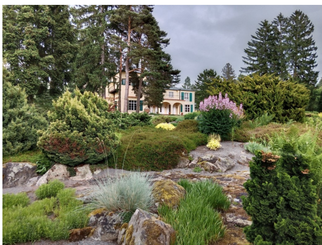
Skalka u vily Benešových v Sezimově Ústí