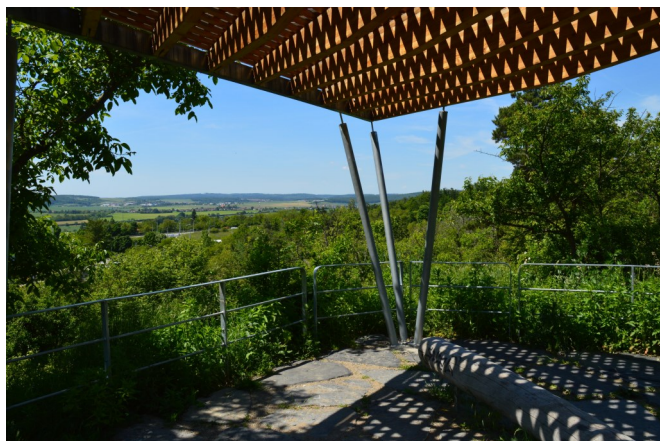
Park Kamenný vrch v Brně

— Petr Förcgott, garant čísla a předseda red. rady ZPK