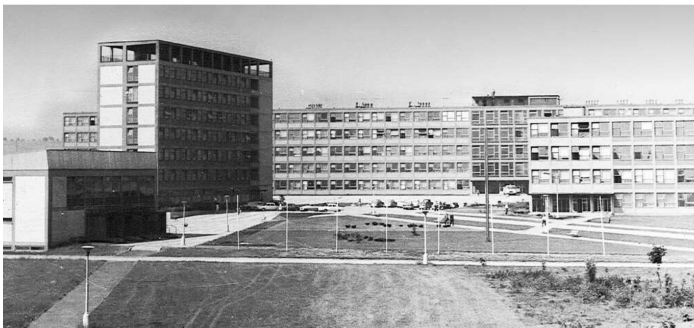
Areál ČZU v době výstavby (1965)