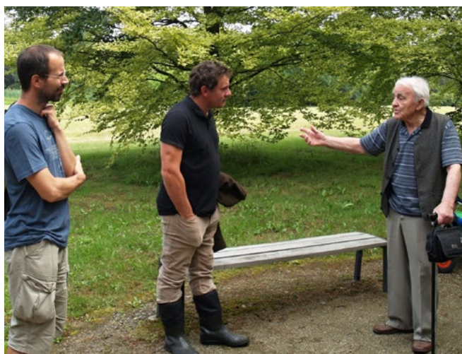
Setkání dobrovolníků SZKT 2018