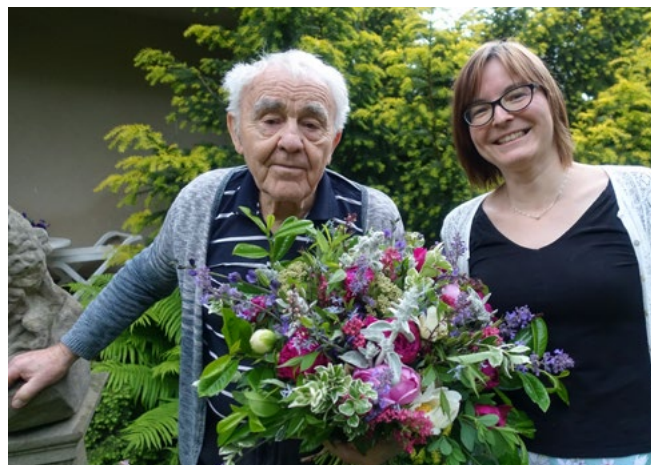
Spontánní návštěva při příležitosti 90. narozenin v červnu 2020 a stejně spontánní kytice z Libosadu.